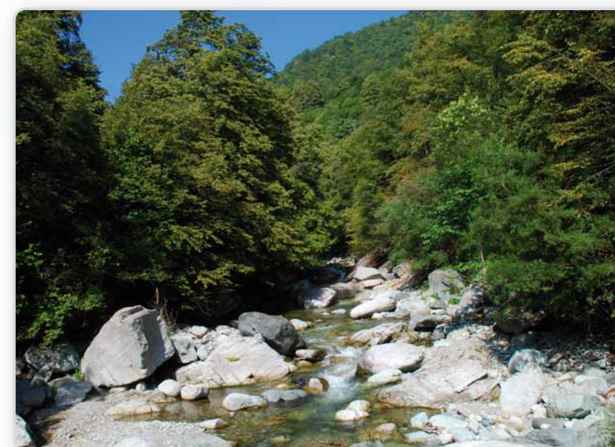
Le latifoglie incorniciano il Po a Paesana