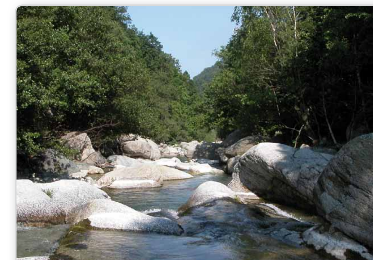
A Oncinio il Po scorre in un letto di roccia