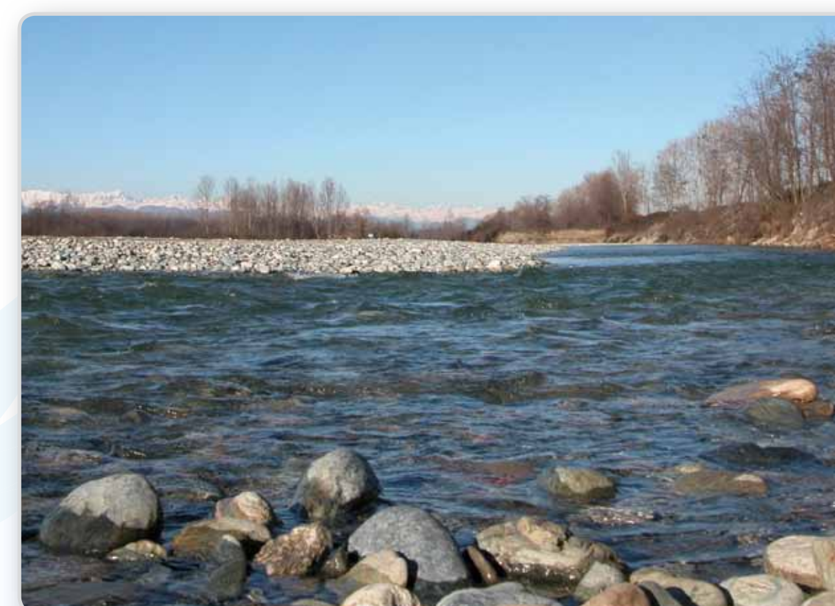
A Faule il Po riceve il torrente Pellice