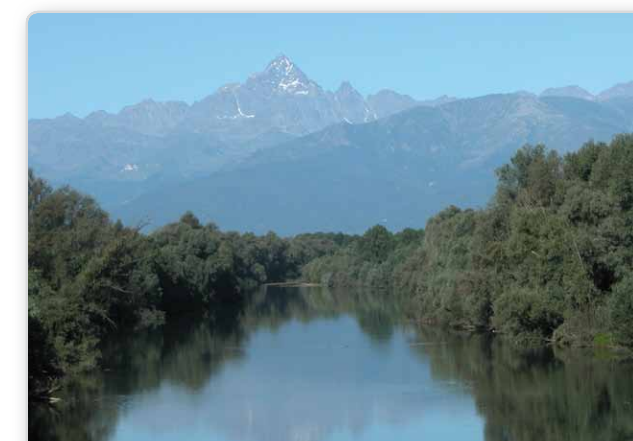
Il Po dal ponte di Casalgrasso