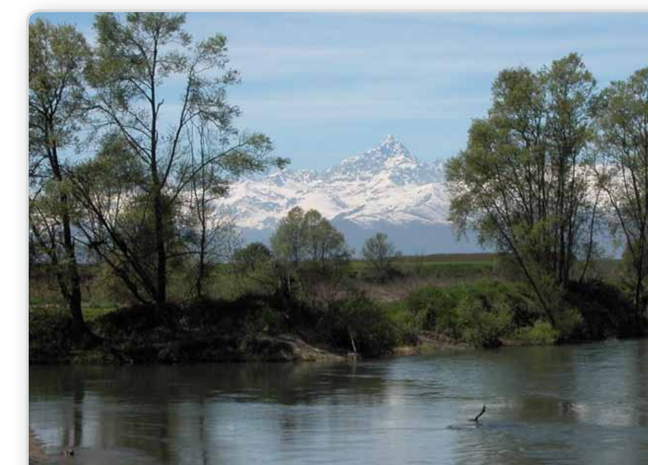
A Faule il Po riceve il torrente Pellice